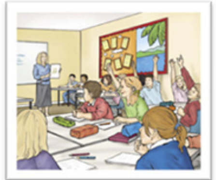
Na sala de aula