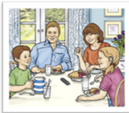
Durante as refeições