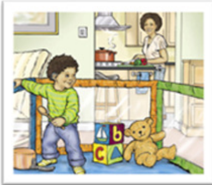
Quando existe distância

O sistema de FM é uma tecnologia que permite acesso a informação sonora quando o ruído e a distância prejudicam a compreensão de fala. Veja aqui alguns exemplos de situações em que o Sistema de FM pode ser utilizado: