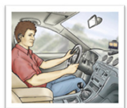
No carro, com GPS