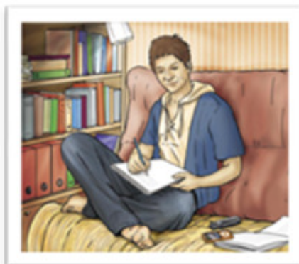
Conectado ao MP3