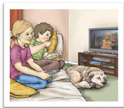
Para assistir TV