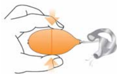
Bombinha de limpeza e tubo